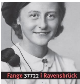
Fange 37722 i Ravensbrück