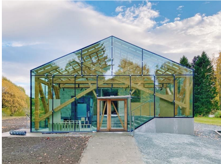
Kommandantboligen 2020. Eksteriør, tilbygg ved Jensen & Skodvin arkitekter AS.