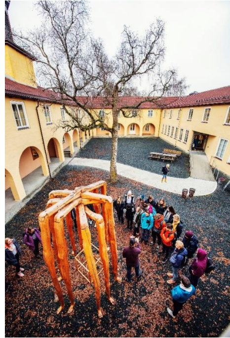
Undervisning i borggården på Falstadsenteret