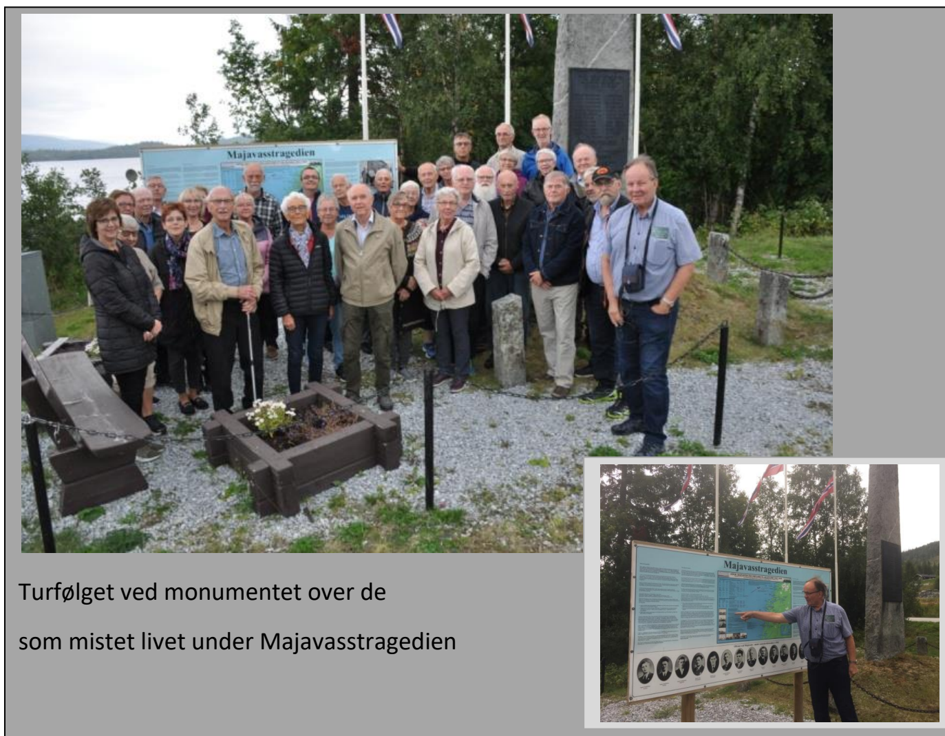
Turfølget ved monumentet over de som mistet livet under Majavasstragedien

Majavasaken var tema, og denne gangen fikk deltakerne et svært godt innblikk i smugleruter fra havet og inn Vistenfjorden hvor utstyr, våpen og ammunisjon ble ført til lands.