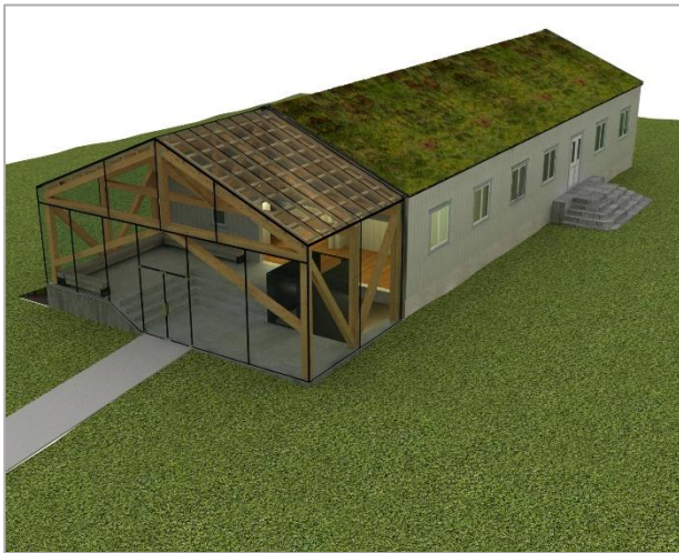
Illustrasjon: Jensen&Skodvin arkitekter

Grunnlagsdokument. Falstadsenteret juni 2017