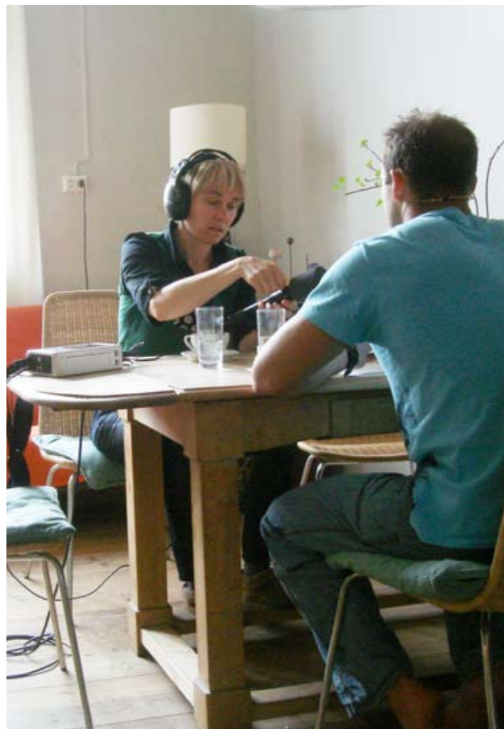
“Ears of the field”, innsamling av lyder og stemmer / the artist collecting sounds and voices.

“The acoustic signature of a place changes over time. As do our stories... When I collect sounds, I’m looking for two kinds of acoustic images: ambiance (wind in the trees, a spring day in the forest) and precise source objects (a bird, the distinct sound of a near-by brook). Sometimes a photograph takes on an added interest by being taken at an historical site. Similarly, sounds recorded at the site of well known historical events are coloured by the knowledge of these happenings. When I was given this commission, artistic challenges became overshadowed by my investigations. I make phone calls and I speak to people. The stories they tell me make a mutually enhancing impact on me. I listen, become touched and gradually something changes. I am seized by a wish to pass this on to the public – and somehow the gap in between no longer seems so great.” Siri Austeen