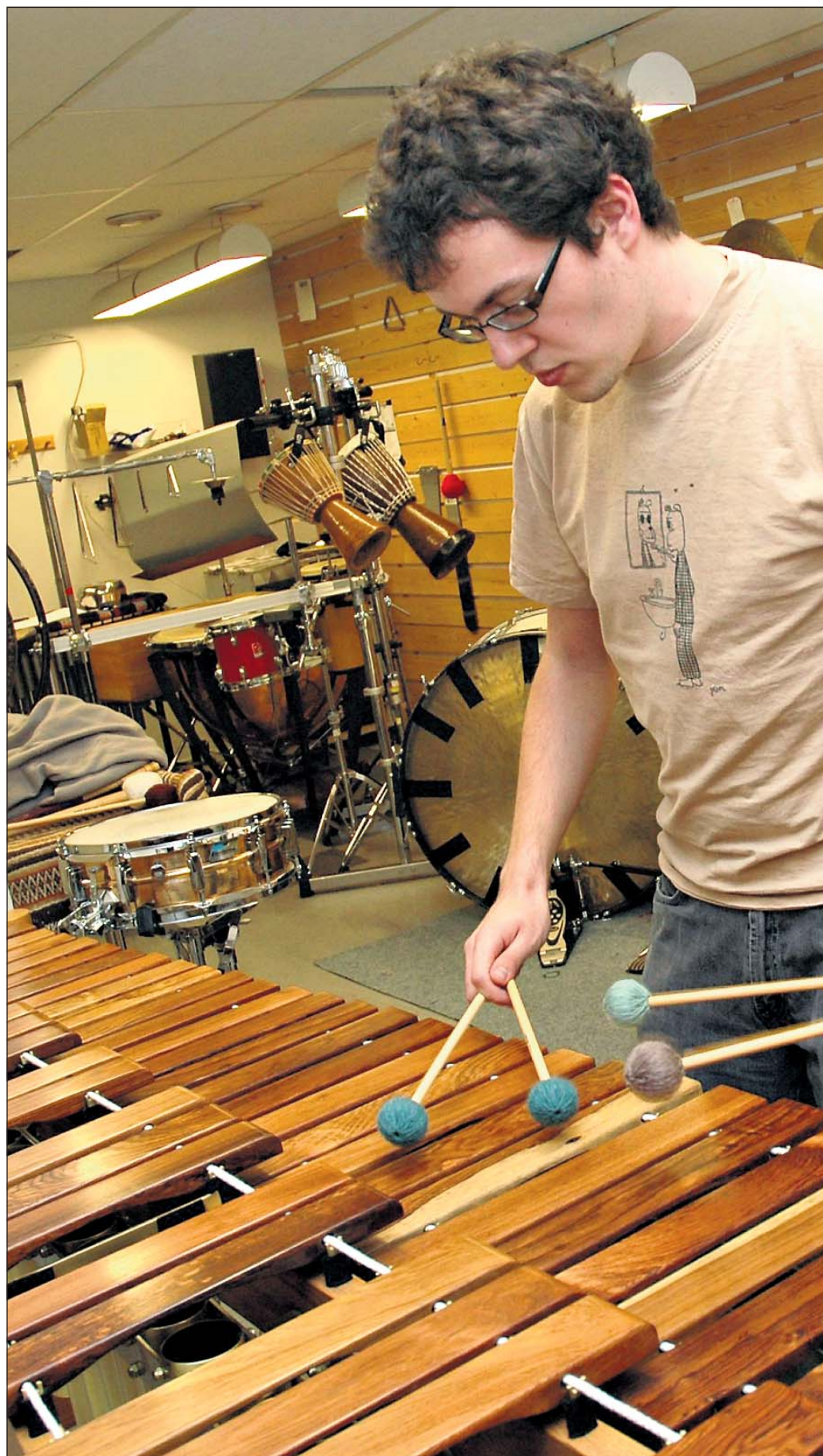
MELODIØST MED MARIMBA: Stjørdalingen lover at det blir melodiose toner under slagverkkonserten