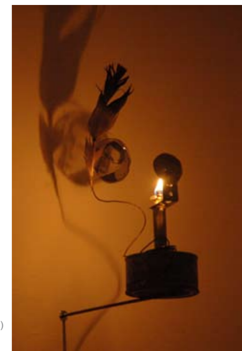
«Ears of the field» (øverst/top) og/and «The long Silence».