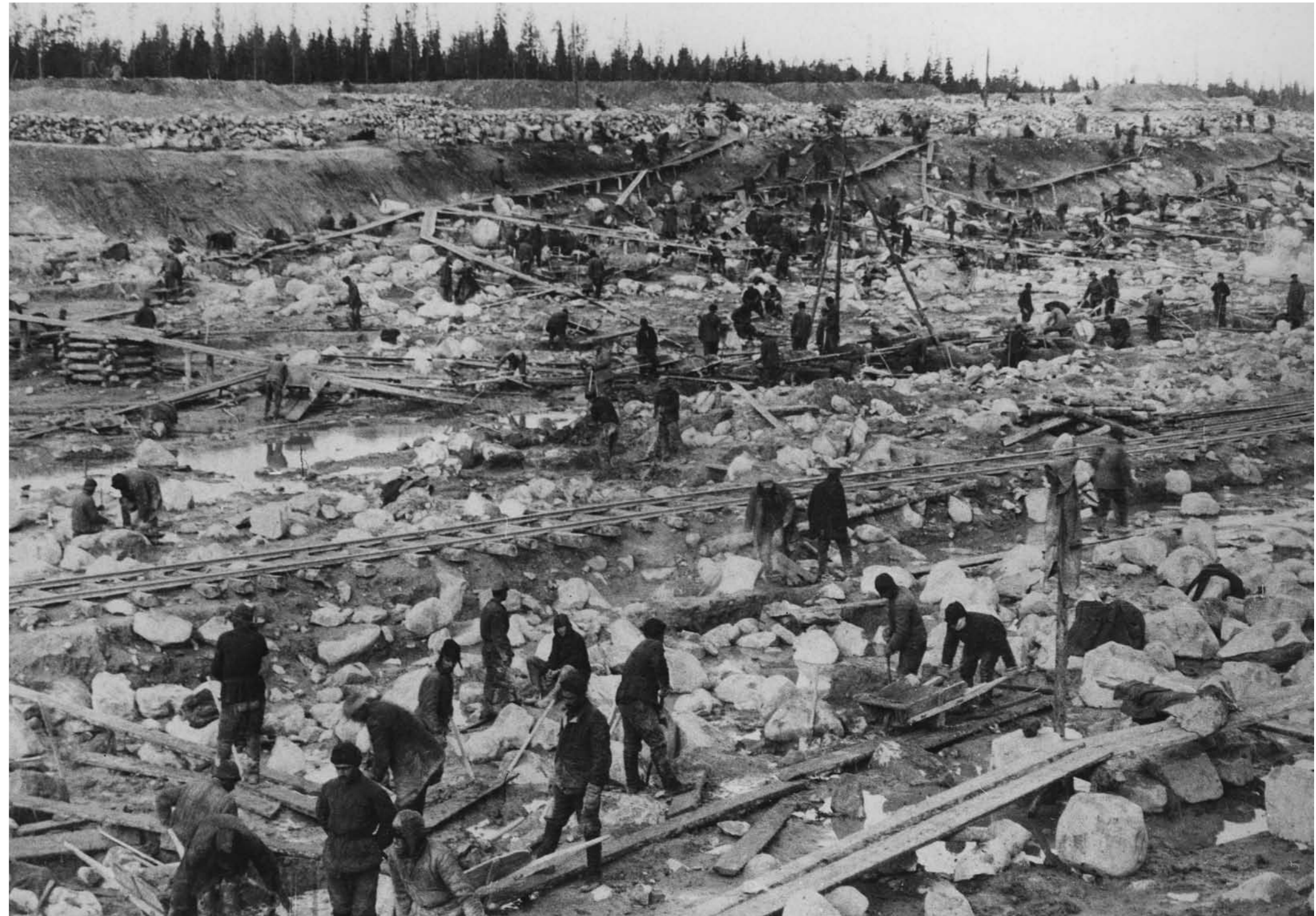
Konstruksjon av Kvitsjø-kanalen, 1932.

På begynnelsen av 1940-tallet sank antallet dødsdommer merkbart. Parallellt med dette ble strømmen av fanger som ble sendt til gulagleirene økt og stabilisert. Ifølge den offisielle statistikken, inneholdt gulagsystemet i 1940 2,35 millioner personer. Disse personene var fordelt på 53 gigantiske leirgrupper, med millioner av annekser og underavdelinger, 425 kolonier, 50 barnekolonier og 90 "småbarnshjem". I tiårene som fulgte holdt fangeantallet seg på rundt 2,5 millioner.