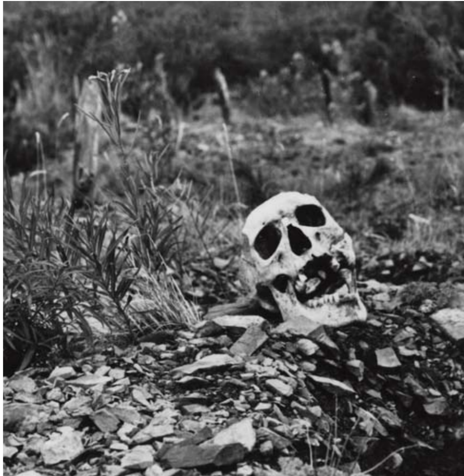
En fanges grav, Kolyma, 1990-årene.

Under de senere årene har Stalinperioden blitt oppvurdert og brukt for å gjenreise Russlands storhet. I 2005 mente 50% av russerne at Stalin hadde vært en god leder, og 12% at han hadde hatt en svært dårlig innflytelse på nasjonen. Han ble i desember i fjor kåret av seere i statskanalen Rossia som den tredje største russer i landets historie.