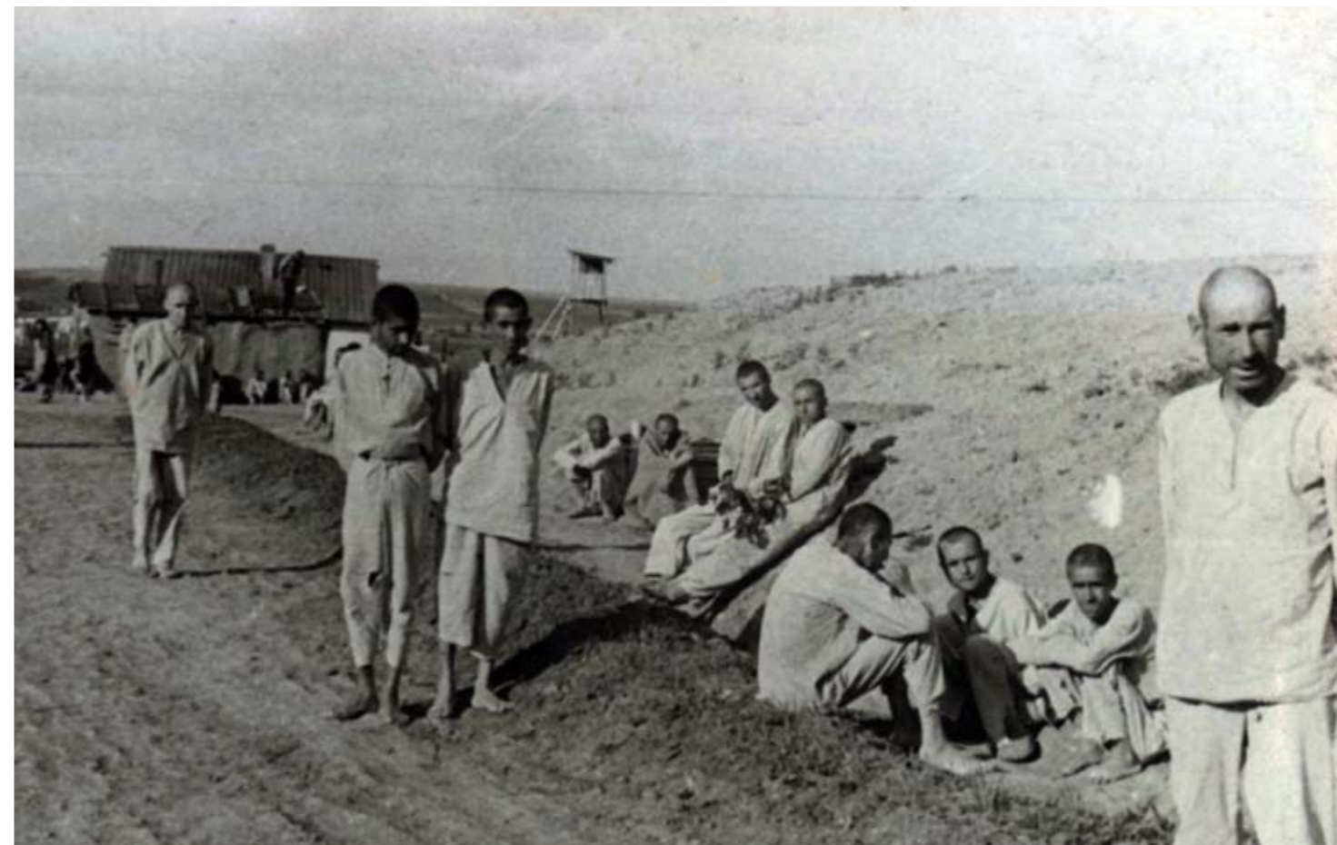
En gruppe fanger hviler, Privolski, 1944.

Etter seieren over nazistene, forventet sovjetborgerne et mer dempet totalitærregime i SSSR, men det stikk motsatte skjedde. Tidligere sovjetiske