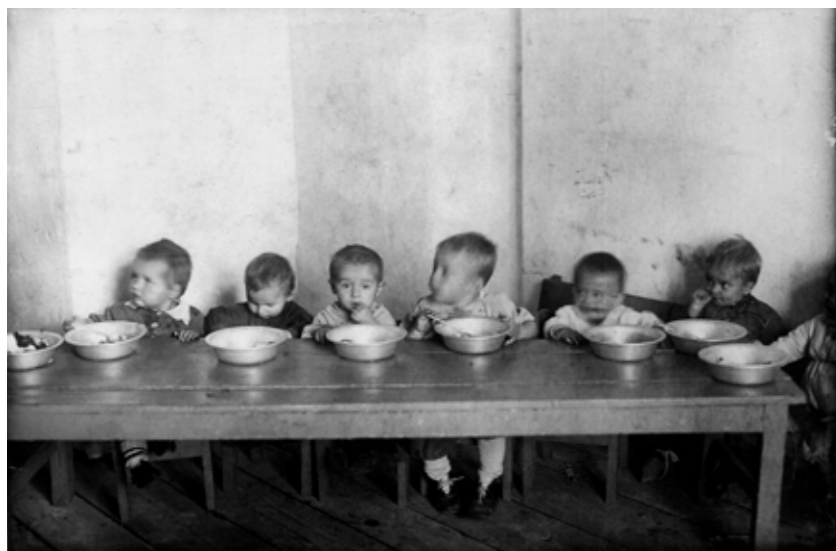
Bilde motstående side: Kvinnelig arbeidsbrigade, jernbanen Baikal-Amur, 1933. Bilde denne side: "Barnehuset" i Jagri-leiren, Arkhangelsk, 1940-årene.

Til midt på 1930-tallet var barna i samme leir som moren helt til de var 4 år gamle. Senere ble alderen redusert til 12 måneder. Barn som ble skilt fra mødrene, ble sendt til spesielle kostskoler eller barnehjem. Institusjonene barna ble sperret inne i, skilte seg naturligvis fra leirene, men organiseringen og levesettet var karakterisert av det samme undertrykkende systemet.