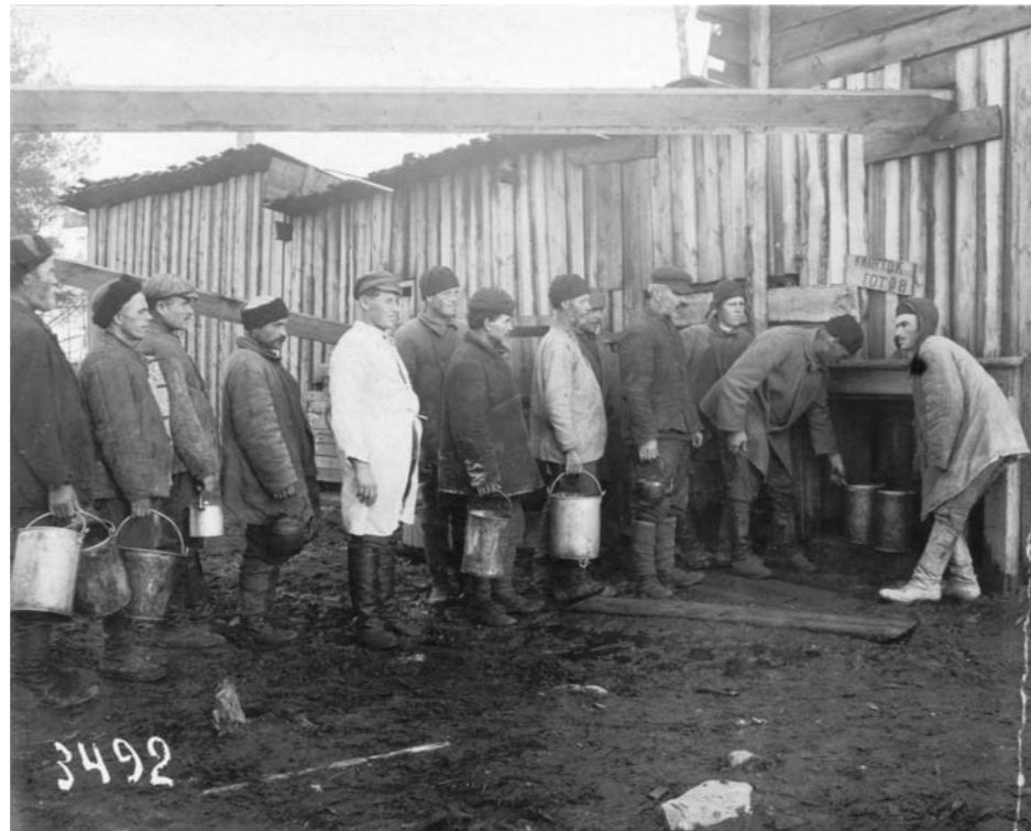
Distribusjon av varmt vann (ukjent leir).

Mange fanger fikk sykdommer som pellagra, skjørbuk og nattblindhet,