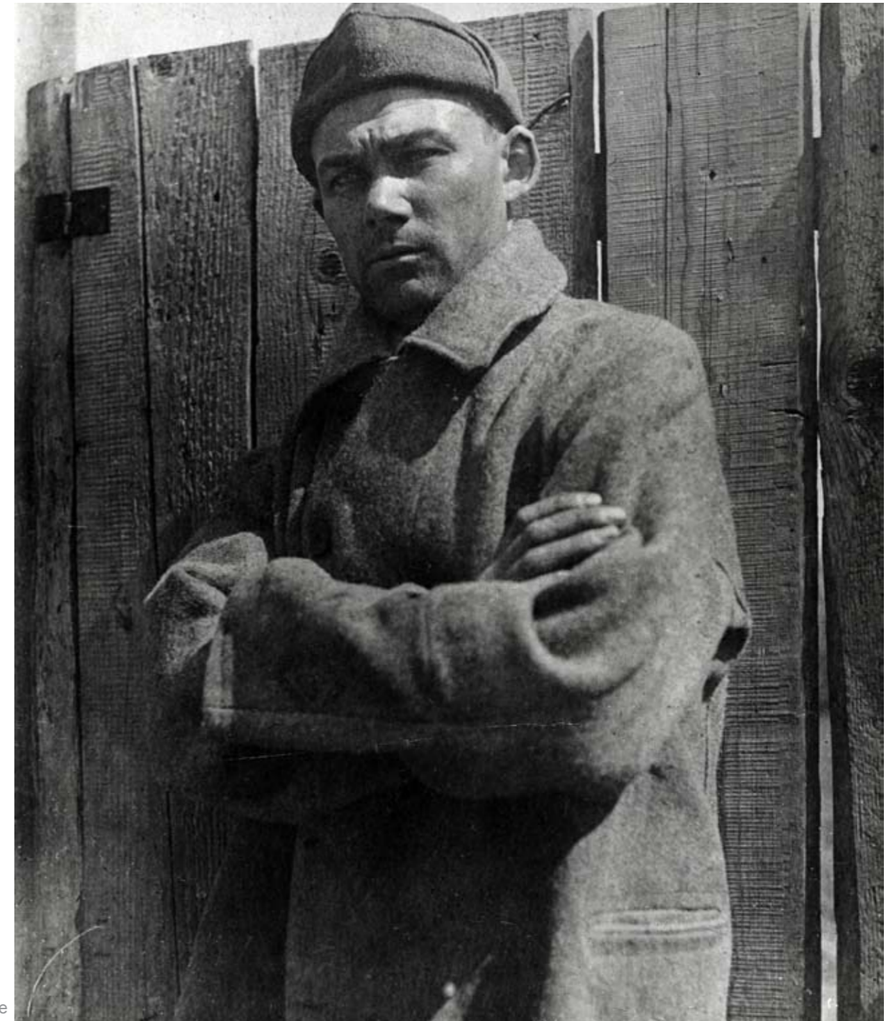
En zek, 1930-årene