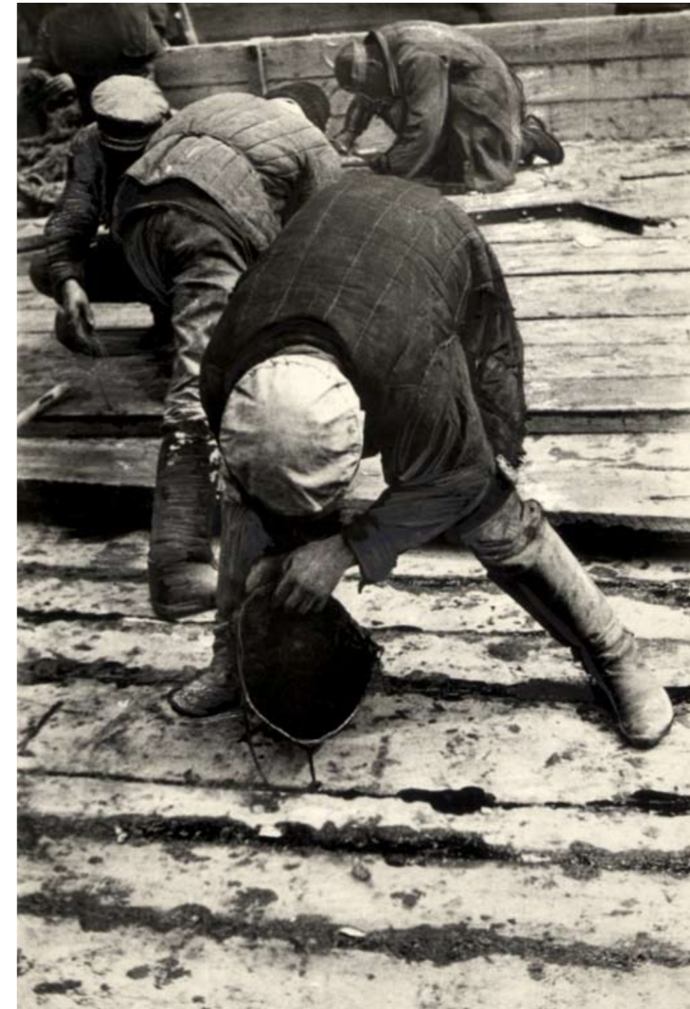
Konstruksjon av Kvitsjø-kanalen, 1932.

utmattet som de var av sult og vanvittig hardt arbeid. Det vil være uriktig å si at det ikke var noen som helst omtanke for helsen til det "levende verktøyet". Men hva fangene enn feilte, torde ikke sykepleierne, de medisinske assistentene og legene å overskride pasientkvoten som var fastsatt i planen. I slike tilfeller begrenset helsearbeiderne seg til å ta en halvdød manns puls og så erklære ham som "ved god helse", for deretter å sende ham tilbake til arbeid.