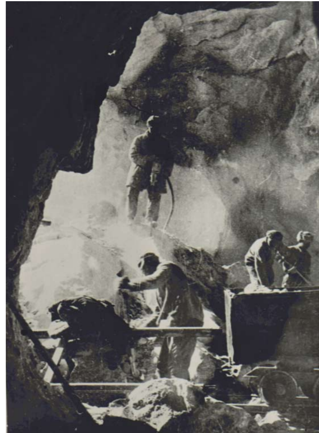
Gruvearbeid i Kolyma, 1943.

Spesialiserte tidsskrifter med temaet "oppfinnelser og rasjonaliseringstiltak" ble utgitt. Oppfinnere fikk større matrasjoner og andre fordeler, blant annet redusert dom og til og med tilbakeføring av borgerrettigheter.