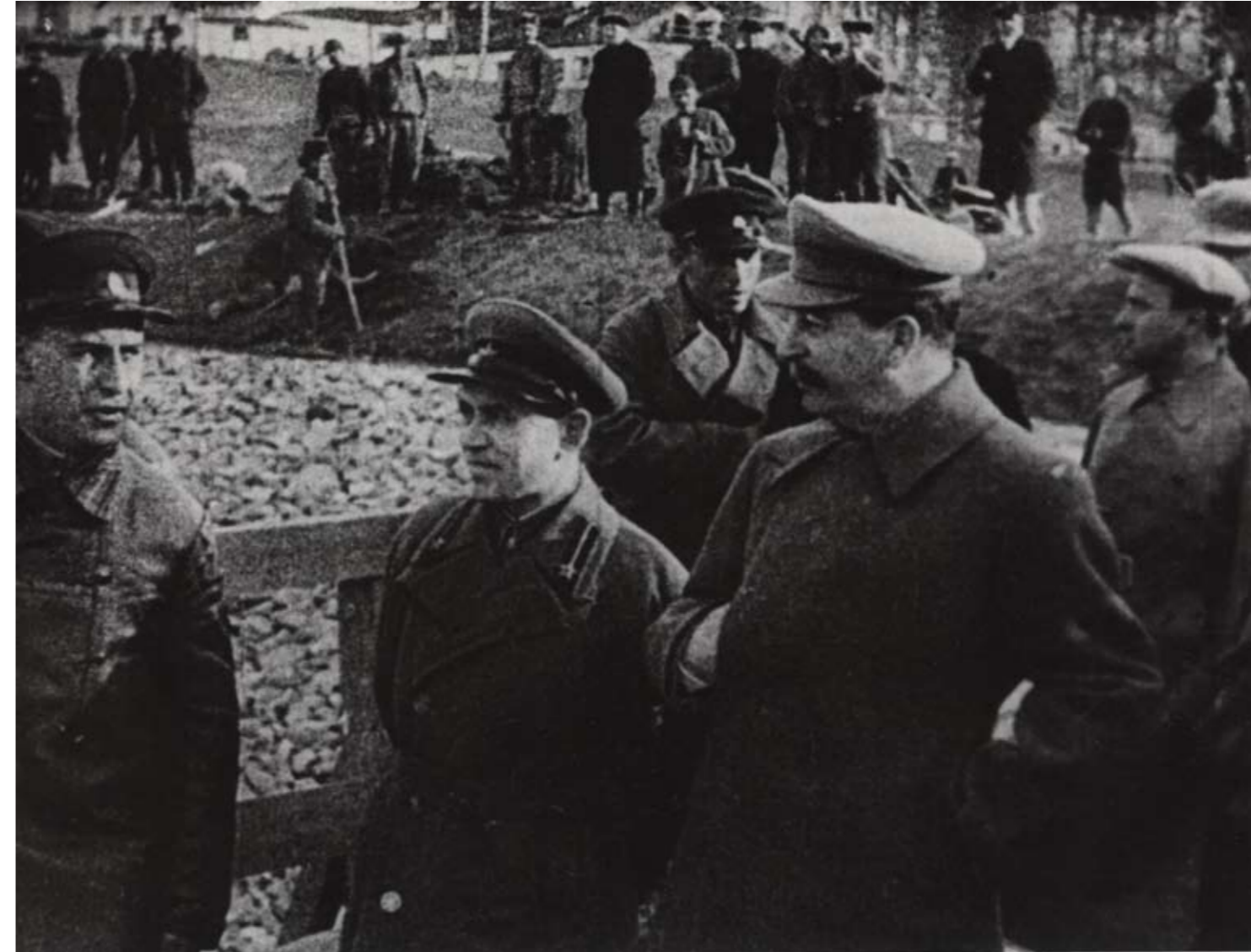
Stalin og NKVDs sjef Jezjov befærer konstruksjonen av Kvitsjø-kanalen, 1934.

Leirlivet ble regulert av ordrer og signaler. En fange som brøt en regel eller ikke adlød ordre kunne risikere ulike typer straffer. Han kunne bli slått, overskylt med vann og tvunget til å stå ute i iskulden, bli innestengt eller sendt til straffecellen. Forbrytelsen kunne være alvorlig, som det å nekte å gå på arbeid eller å yte motstand mot autoritetspersoner. Forbrytelsen kunne også bestå av noe helt absurd, som å ikke være "passende kledd".