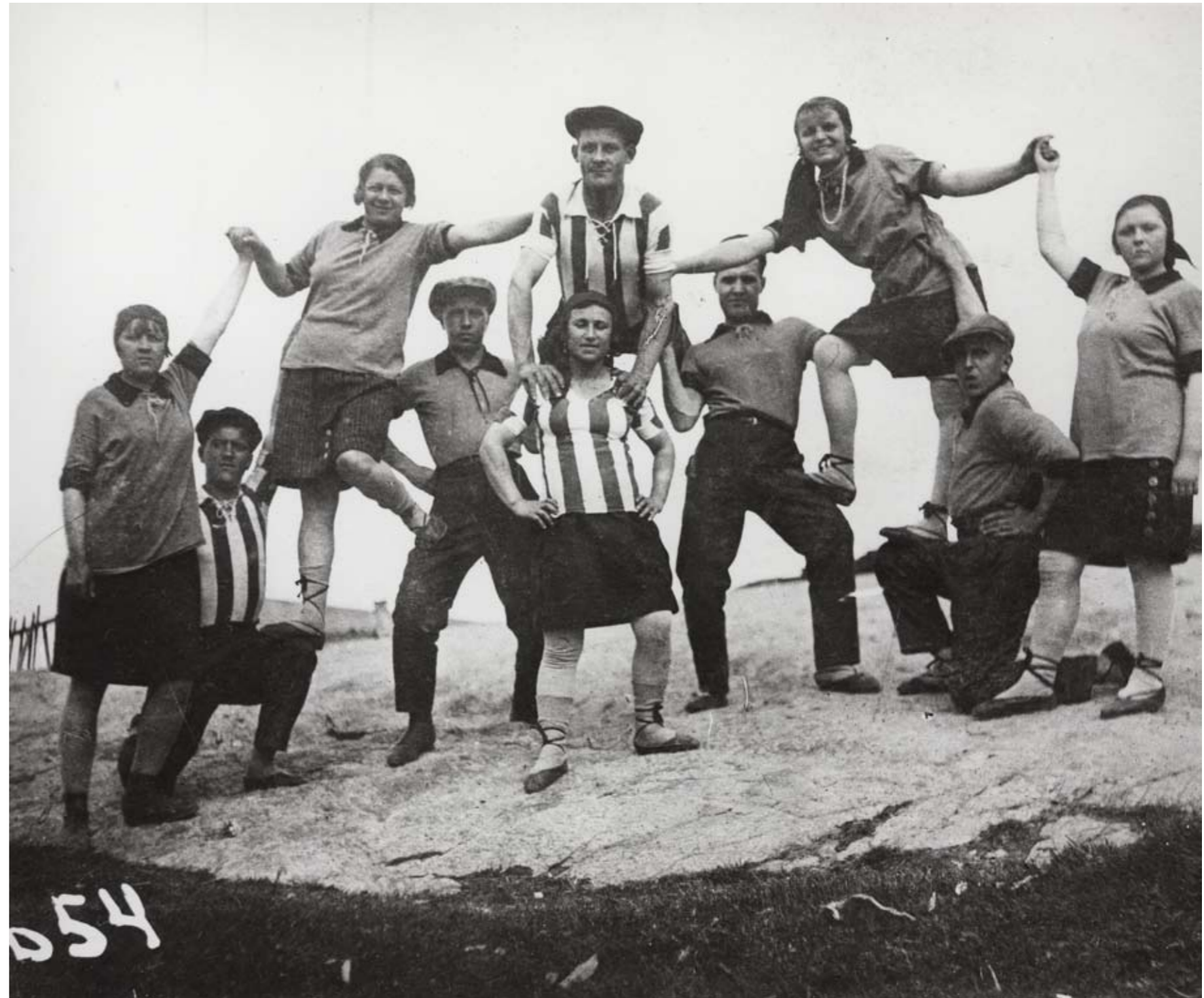
Forestilling fra propaganda-brigaden, Kvitsjø-kanalen, 1932.

Etter Den store terroren fra 1937 til 1938 forsvant kultur- og utdanningsavdelingens arbeid raskt. Teater var et slags unntak. Teateret fikk en gjenoppliving etter andre verdenskrig. Kommandantene i de store leirene la mye prestisje i "sitt" teaterkompani, men for fangene utgjorde teatret en levende påminnelse om en annen og for dem fullstendig tapt verden.