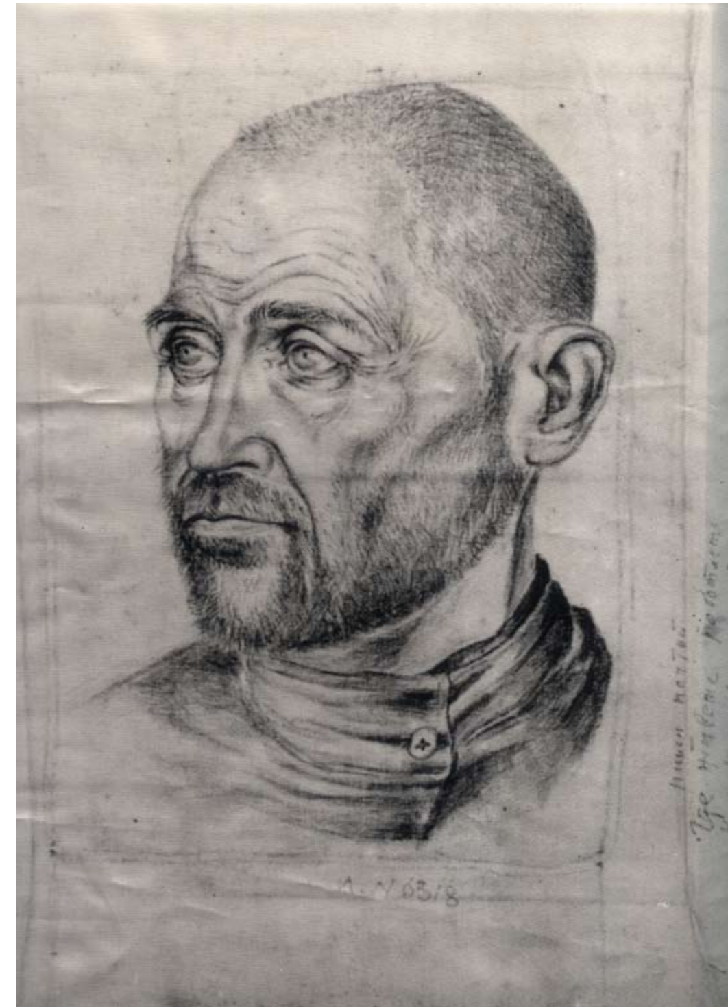
Portrett av en zek (ukjent kunstner), 1940-årene.

Dette gav opphav til det som etter hvert ble kalt en kultur i lommestørrelse. Små ting kunne lettere gjenminnes uten å bli sett, kunne lettere forkles og beholdes som en privat eiendel. Små portemonéer, små brødposer, og esker i enhver tenkelig utforming var av de mest typiske tingene i zekenes materielle verden. Kvinnelige fanger lærte seg å lage synål av fiskebein eller av ødelagte biter fra kammen. Resten av overflødig materiale ble plukket opp og forvandlet til skjeer, boller og andre gjenstander.